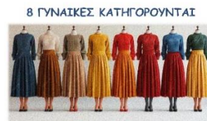
του Ρομπέρ Τομά

Σε μια απομονωμένη έπαυλη, ο μοναδικός άνδρας του σπιτιού βρίσκεται δολοφονημένος στο κρεβάτι του. Οκτώ γυναίκες, όλες πρόσωπα του στενού του περιβάλλοντος, παγιδεύονται στο σπίτι λόγω της κακοκαιρίας και των κομμένων καλωδίων του τηλεφώνου. Καθώς η έρευνα για τον δολοφόνο ξεκινά, τα προσώπια πέφτουν. Μέσα από συνεχείς ανατροπές, αποκαλύπτονται καλά θαμμένα μυστικά, αντιζηλίες και ψέματα, αποδεικνύοντας ότι καμία από τις γυναίκες δεν είναι πραγματικά αθώα.